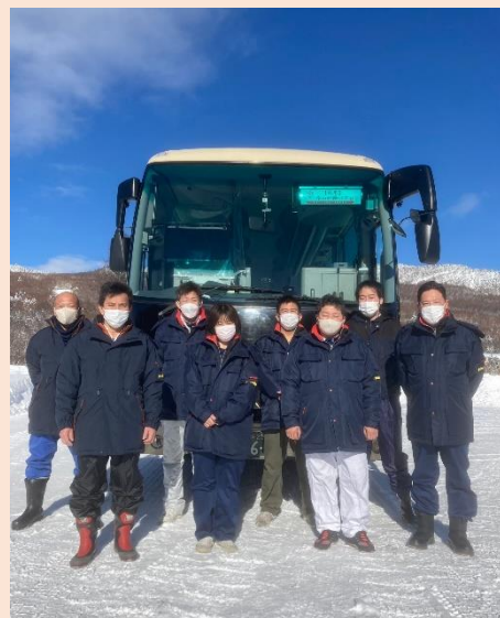
志賀高原での集合写真