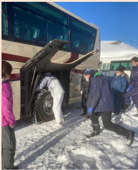
昼間の志賀高原にて