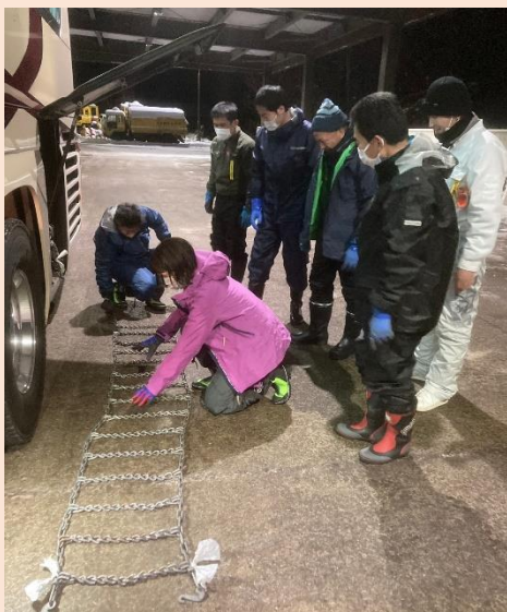
深夜、上林のチェーン脱着所にて